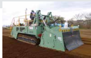
ストーンセパレータによる混合状況

現状土が硬くなっていたり、転石が混在しているグラウンドにおいては、分級機能を併せ持つ、『ストーンセパレータ』を併用することにより、粒度分布の改善・混合性の向上を図ることができます。