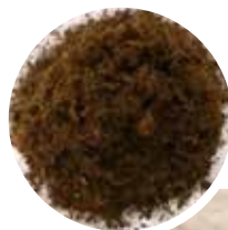
インプルクレイ素地混合後のグラウンド