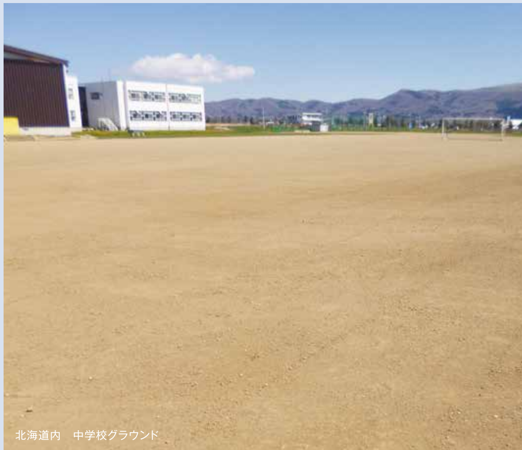
北海道内 中学校グラウンド