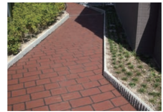
ベビーカーが通る遊歩道