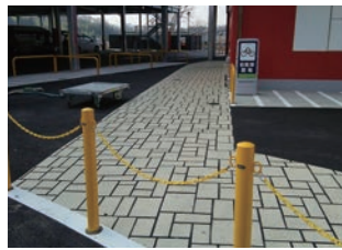
ショッピングセンター構内