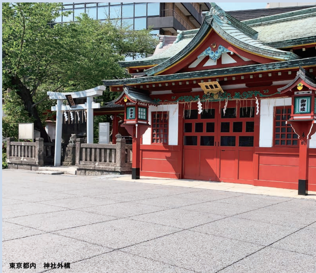
東京都内 神社外構