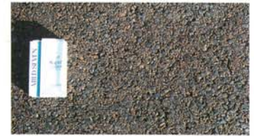
Aタイプ(密粒タイプ)の表面