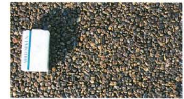
Cタイプ(透水タイプ)の表面