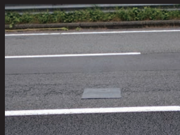
高速道路での適用例

PMR99+は、強さと柔軟性を兼ね備えた超高粘度アスファルトマット型舗装補修材です。損傷の初期段階（小面積のひび割れなど）で路面に貼り付け補修を行います。舗装の延命化を図り、ライフサイクルコストを低減させ、予防保全的維持に最適な材料です。