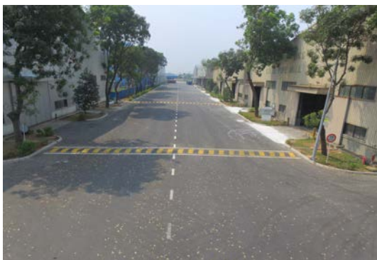
改質アスファルト（SBS）を使用した舗装改修工事 コンクリート舗装の破損がひどく改質アスファルトでの改修工事を行いました。品質・コスト面でも評価を受けました。 【ビンズオン省】