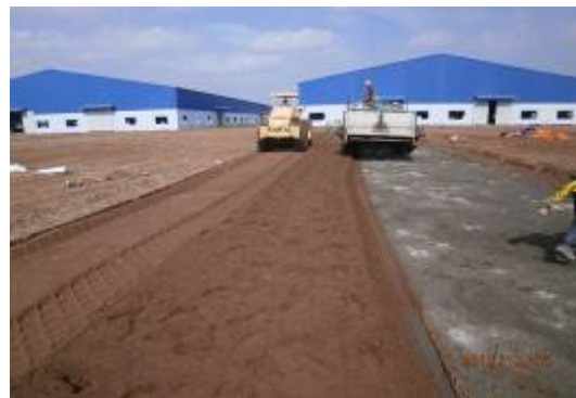
スタビライザーによるセメント改良工事 日系ゼネコンを始め、ローカルゼネコンからも受注しています。 【南部メコンデルタ地区】