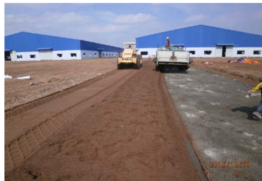
スタビライザーによるセメント改良工事 日系ゼネコンを始め、ローカルゼネコンからも受注しています。 【南部メコンデルタ地区】