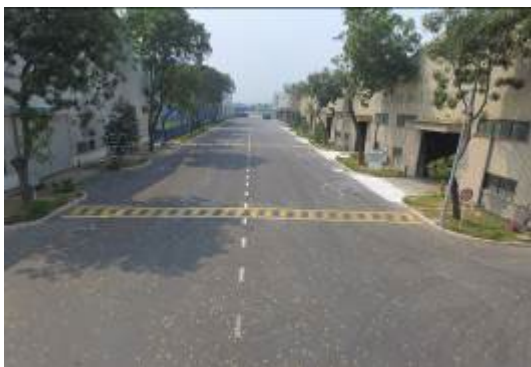
改質アスファルト (SBS) を使用した舗装改修工事 コンクリート舗装の破損がひどく改質アスファルトでの改修工事を行いました。品質・コスト面でも評価を受けました。 【ビンズオン省】