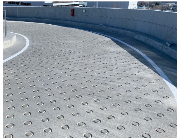
真空コンクリート刷毛仕上げ