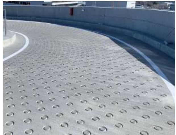
真空コンクリート刷毛仕上げ